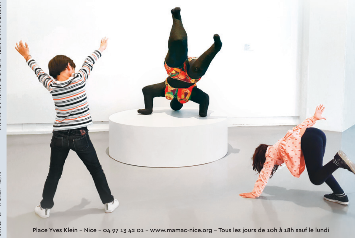
En couverture : Niki de Saint Phalle - Nana noire up and down

Alone, with family or friends, with your grandchildren, enjoy a unique experience at the museum and a great moment of complicity.